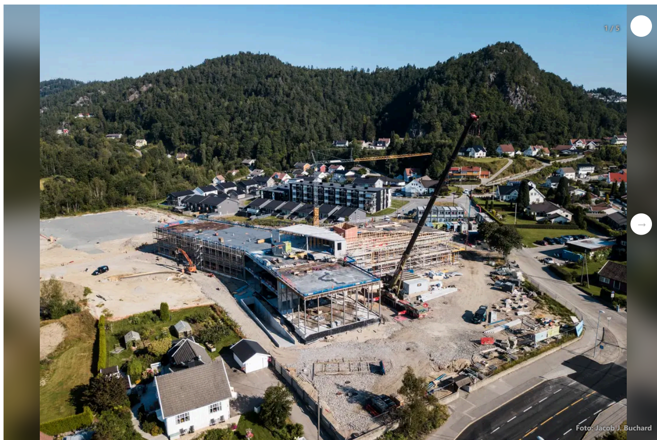
Mosby oppvekstsenter skal stå ferdig til skolestart neste år.

I tillegg til Kringsjø er følgende utbyggingsprosjekter enten igangsatt eller på trappene: